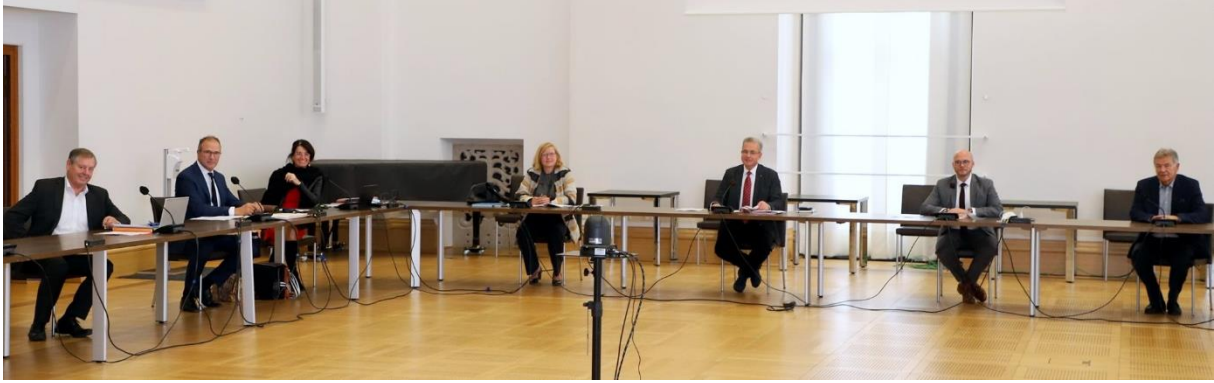
Unser Fraktionsvorstand im Senatssaal des Maximilianeums

Beschäftigt hat uns in der Kinderkommission des Landtags auch der Bericht des Staatsministeriums der Justiz zum Thema „Kinderpornografie und Kindermissbrauch“ - trauriger Alltag für tausende Kinder und Jugendliche in Deutschland. Deshalb unterstützen wir eine Ausweitung bisheriger Vergehenstatbestände auf Verbrechenstatbestände sowie eine Strafverschärfung für Betreiber von Missbrauchsnetzwerken und Tauschplattformen . Auch bedarf es einer Optimierung der Ermittlungsansätze, um Täter und größere kriminelle Strukturen besser identifizieren zu können. Betroffene Kinder und Jugendliche brauchen klar erkennbare Anlaufstellen, in denen sie Hilfe erhalten. Daher befürworten wir das vom Bayerischen Landesjugendhilfeausschuss beschlossene Konzept für ein bayernweites Ombudschafswesen und die Weiterentwicklung interdisziplinärer Schutzkonzepte gegen sexuellen Missbrauch von Kindern und Jugendlichen . Hier kann in Kitas, Schulen und der Jugendarbeit im Rahmen einer multiprofessionellen Vernetzung zwischen allen beteiligten Akteuren und Einrichtungen viel Gutes bewirkt werden. Wir setzen uns außerdem dafür ein, dass sich Bayern auch weiterhin mit dem Positionspapier „Gemeinsam gegen sexuelle Gewalt an Kindern und Jugendlichen“ des Unabhängigen Beauftragten der Bundesregierung für Fragen des sexuellen Kindesmissbrauchs intensiv auseinandersetzen wird – im Interesse aller jungen Menschen im Freistaat.