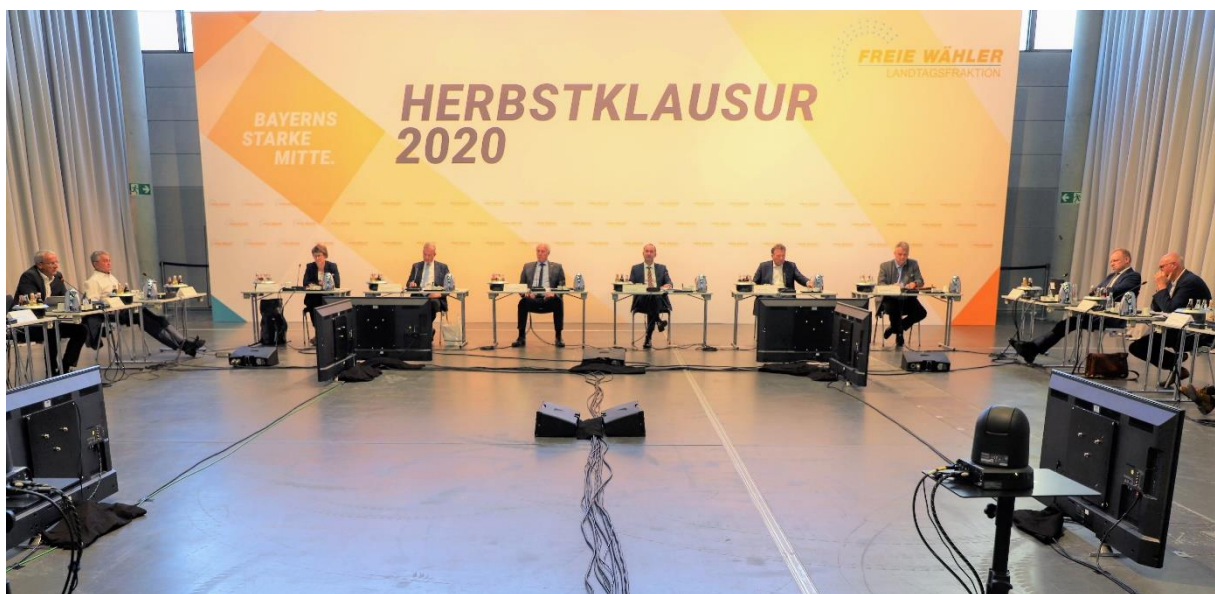
Herbstklausurtagung in München vom 09.-11.09.2020