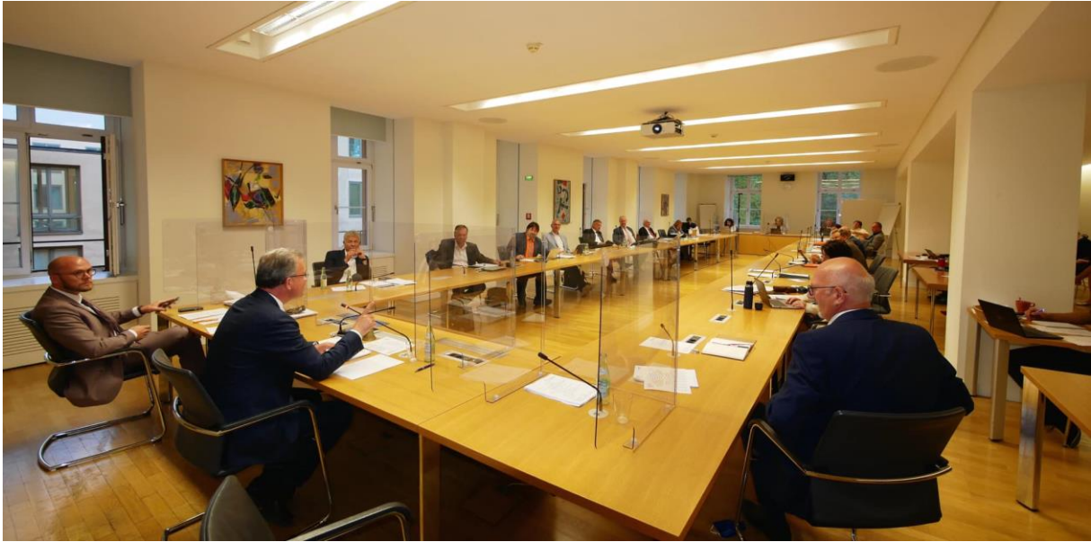
Erste Fraktionssitzung nach der parlamentarischen Sommerpause

Als Erfolg konnten wir klar verbuchen, dass sich unser Regierungspartner endlich unseren steuerpolitischen Forderungen anschließt. Denn seit jeher fordern wir die vollständige Abschaffung des Solidaritätszuschlags . So haben wir uns mit einer Vielzahl von Dringlichkeitsanträgen klar gegen den „Soli“ und für eine Senkung von Unternehmenssteuern starkgemacht. Doch die Umsetzung scheiterte bisher am Widerstand einiger Bundesländer und der Bundesregierung – an welcher die CSU beteiligt ist. Doch nun müssen den Worten auch Taten folgen. Die unsägliche Zuschlagsteuer zum Wiederaufbau der östlichen Bundesländer hat ihre Berechtigung bereits seit Jahren verloren und ist nun umgehend und ersatzlos zu streichen. Mittelstand und Steuerzahler dürfen gerade in der Krise nicht weiter geschröpft werden: Der Soli muss endlich weg!